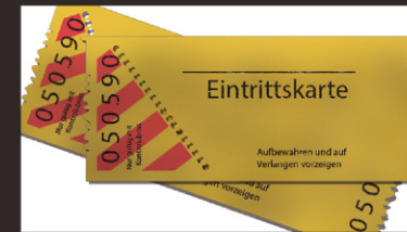
전시회 초대권 지원