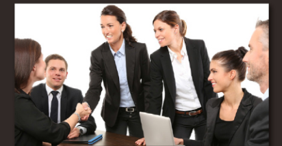
1:1 바이어매칭 지원