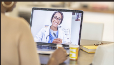
전시회 예산 확보 지원