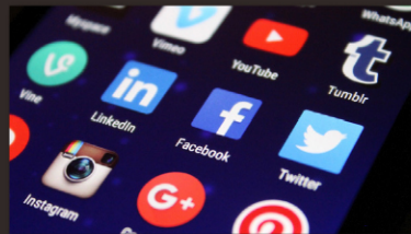
회사/제품 홍보 지원